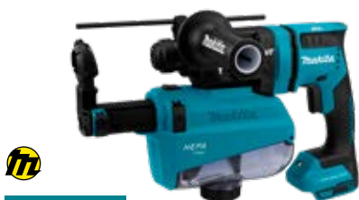
DHR182ZWJU WERKT OP

Boor- en beitelvet, hiermee voorkom je het drooglopen van je boor, beitel of boorkop waardoor de levensduur verlengd wordt