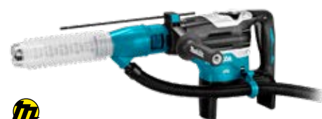
DHR400ZUN1 WERKT OP

2x18 V Combihamer wordt geleverd zonder accu's en lader, in koffer, met stofafzuigset en AWS zender.