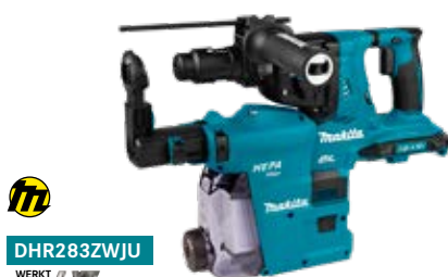
DHR283ZWJU WERKT OP

2x18 V Combihamer wordt geleverd zonder accu's en lader, in Mbox, met stofafzuiging en AWS zender.